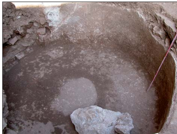
FIGURA 15 Estructura circular romana.

Este tipo de estructuras, de clara filiación funeraria, es un elemento muy extendido en el ámbito emeritense concretamente en las intervenciones realizadas en la calle Marquesa de Pinares (Mendez 2008), así como junto al mausoleo de la Casa del Anfiteatro (Bejarano y Palma 1995) o las intervenciones realizadas en el antiguo Cuartel de Artillería (Hidalgo y Sánchez 2012), son buenos ejemplos de la utilización de estas estructuras. En total se registraron cuatro tumbas tipo “mensa” y solamente una de ellas, la que se encontraba más incompleta, pudo documentarse una fosa de un individuo en posición decúbito supino, cuya tumba fue saqueada, de la que únicamente conservó como depósito funerario un objeto de cerámica común.