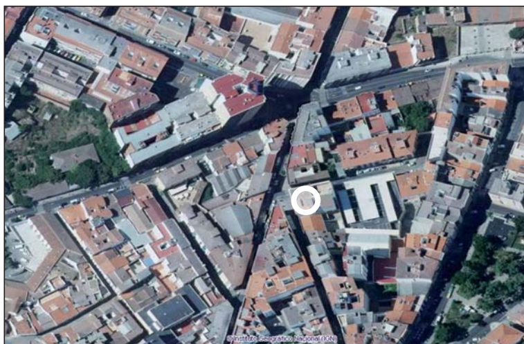
SITUACIÓN DEL SOLAR