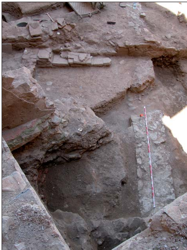
FIGURA 14 Muros romanos y camino.

hidráulico de gran calidad, decoradas con elementos de tipo geométrico (bandas de color) y vegetal (flores bipétalas). Los autores de la fábrica utilizaron una gran proliferación de colores destacando sobre todo el rojo, amarillo o azul.